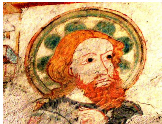
Johannes der Täufer in Spital bei Weitra/Niederösterreich, um 1360

GEBURT DES HL. JOHANNES DES TÄUFERS 24. JUNI